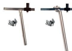
Sadelstolpe med T-fäste