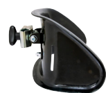
Ryggplatta med fäste

5000-0280-02 (S) Ryggstöd med 2 justerbara ryggplattor. 5000-0282-02 (M) Ingår: U-båge 45 cm. 5000-0284-02 (L) 2 ryggplattor, bälte och T-stolpe 27,2 x 350 mm. Passar 20-24".