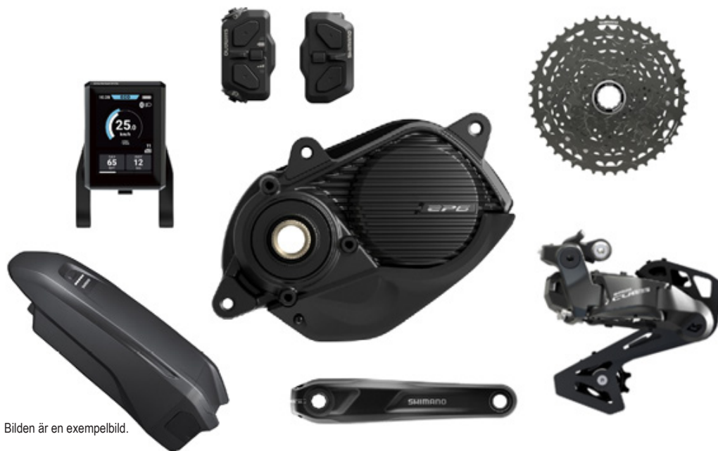
Bilden är en exempelbild.